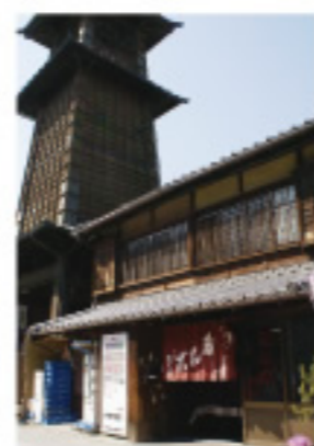
時の鐘を眺めながらのお団子は格別。

川越市の中心部「時の鐘」のすぐ隣に店を構える、手作りにこだわった団子屋さん。メニューは1本60円、醤油ダレの焼き団子のみで、早ければ13時頃には完売するとか。お持ち帰りだけでなく店内の長椅子で食べることもできます。「川越は昔からの近所づきあいが残る街。最近では観光客も増えているけどね」というご主人は6代目。創業は江戸末期で、約150年も続いているというから驚きです。実はテレビでも度々取材されている有名店ですが、ご主人はいたってマイペース。「あまり宣伝はしたくないから。お客さんが美味しいって食べてくれば、それが一番」串は1本1本手作りで、長い竹を買ってきて、それを短く切って使っているそう。昔ながらの落ち着いた店内で、歴史を感じることができるお店です。