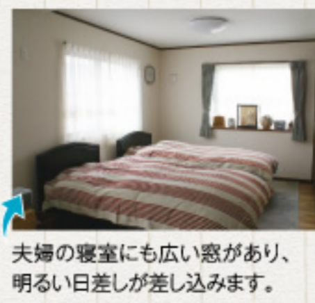
夫婦の寝室にも広い窓があり、明るい日差しが差し込みます。

階段下に設置した収納スペース。他にも和室の押入れ、2階の部屋のクローゼット、納戸など十分な収納を確保しました。