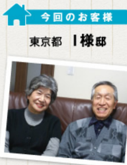
今回のお客様 東京都 | 様邸