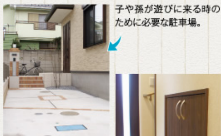
子や孫が遊びに来る時のために必要な駐車場。

階段下に設置した収納スペース。他にも和室の押入れ、2階の部屋のクローゼット、納戸など十分な収納を確保しました。