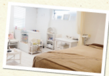
1階はサロンスペース