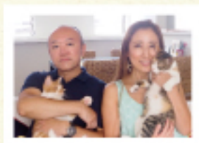
お庭のお客様 埼玉県 M様邸