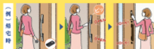
【イラスト】株式会社LIXIL様

従来の手錠錠と比較すると費用はかかりますが、その利便性から使いたいという人が増えています。