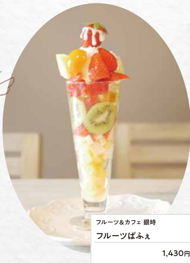
フルーツ&カフェ 銀時 フルーツぱふえ 1,430円