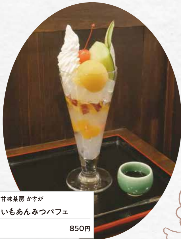
甘味茶房 かすが いもあんみつパフェ 850円