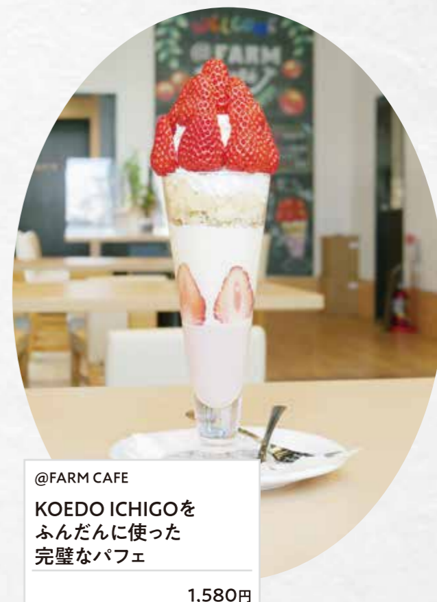
@FARM CAFE KOEDO ICHIGOを ふんだんに使った 完璧なパフェ 1,580円