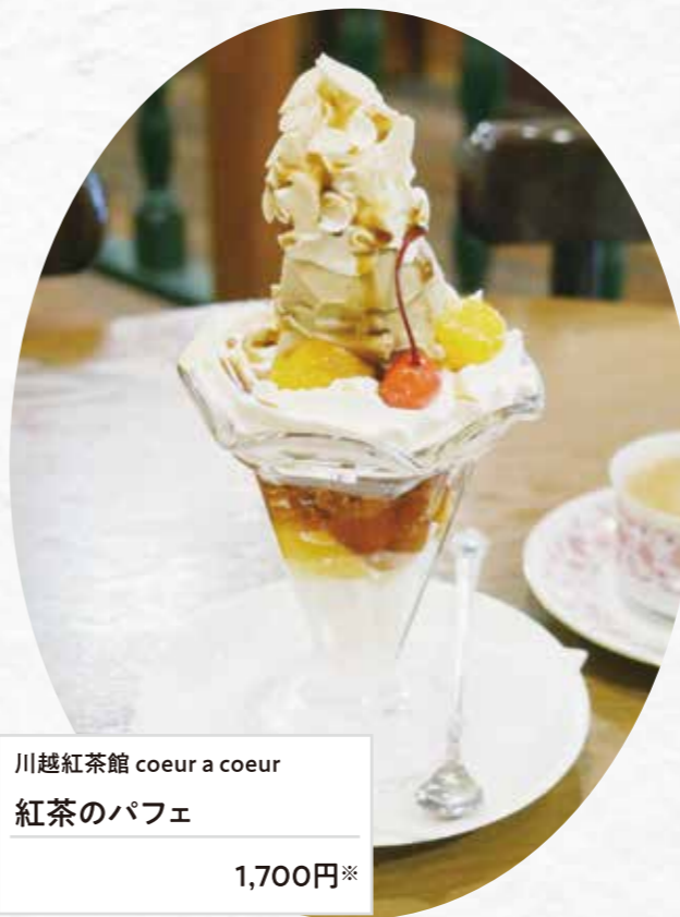
川越紅茶館 coeur a coeur 紅茶のパフェ 1,700円※